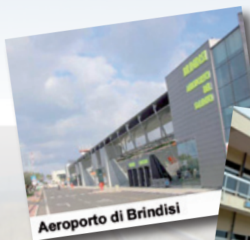
Aeroporto di Brindisi