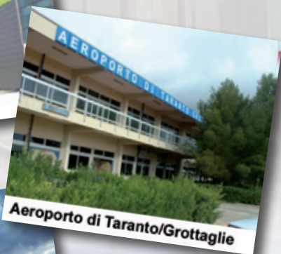
Aeroporto di Taranto/Grottaglie