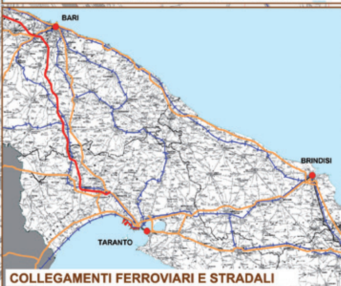
COLLEGAMENTI FERROVIARI E STRADALI