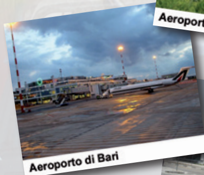
Aeroporto di Bari