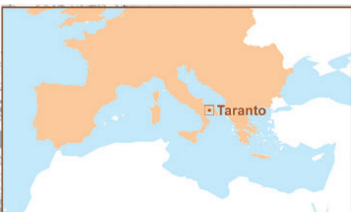
POSIZIONE GEOGRAFICA DEL PORTO DI TARANTO