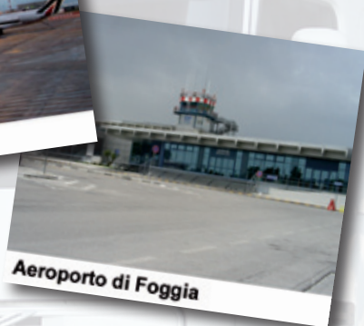
Aeroporto di Foggia